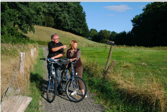
Flüsse-Tour Autor www.hessen-tourismus.de